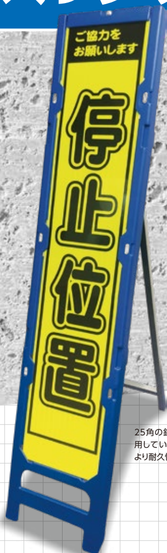
25角の鉄脚を採用しているため、より耐久性UP!