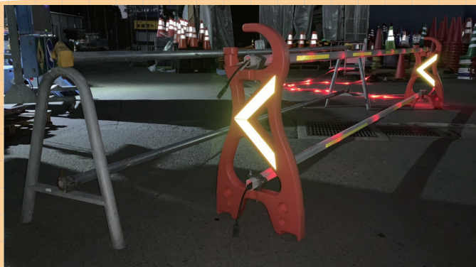
【鉄製単管パイプとの比較】